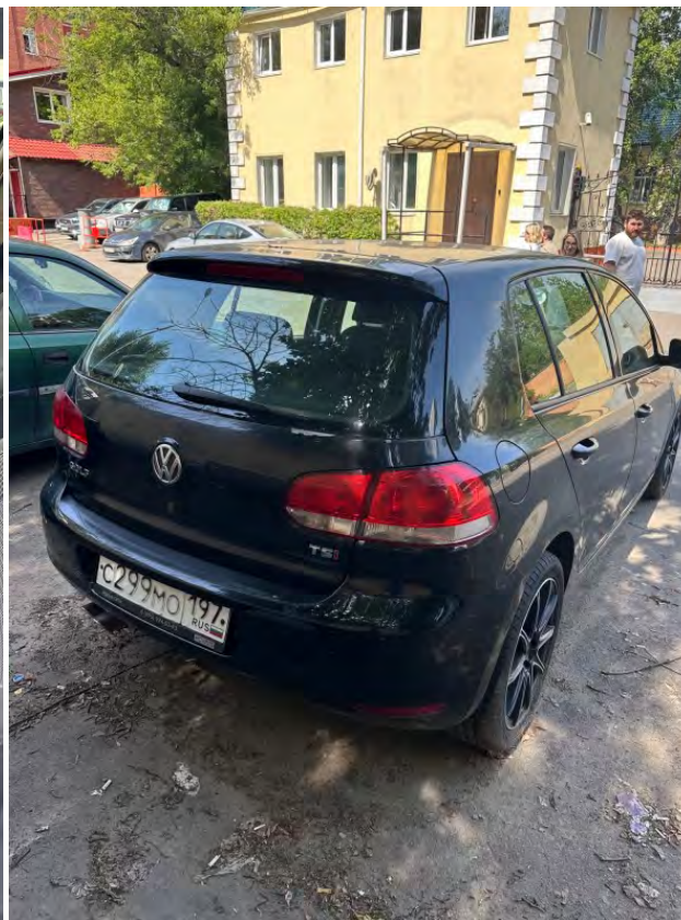
Фото 3 Фото 4