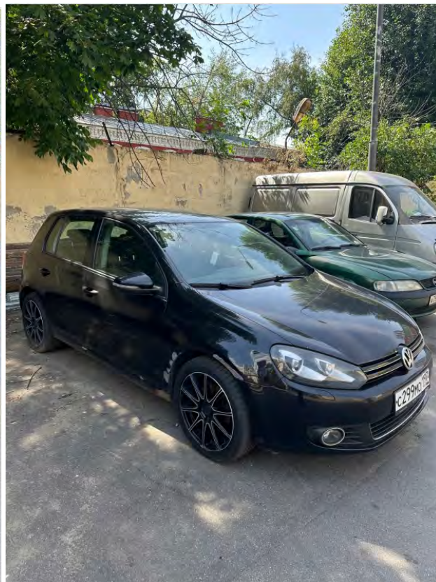
Фото 1 Фото 2