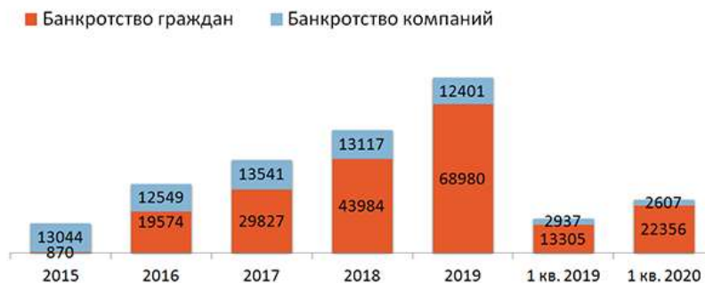
Рисунок 1. Количество новых решений судов о признании компаний банкротами