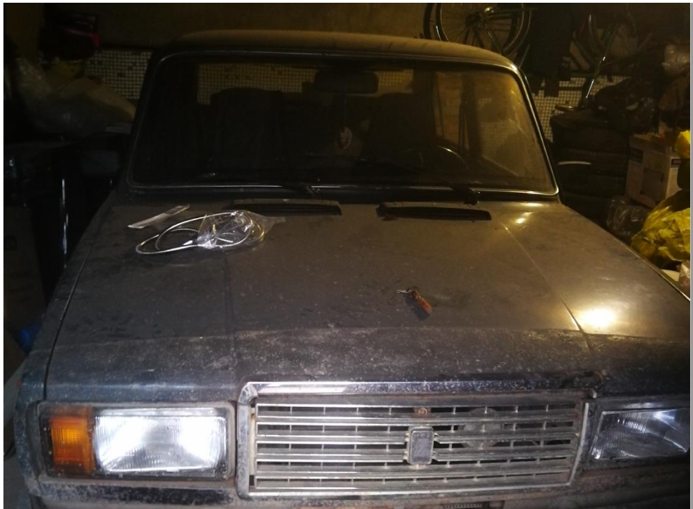
Лот № 1.